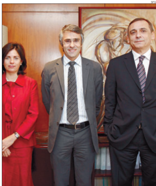
►► Mateu, el membre de l'OCDE Pascal Saint Amans i Mirapeix, al juny.

Aquest és el contingut essencial de la disposició addicional que el Grup Parlamentari Liberal pretén incorporar a la Llei de cooperació penal internacional i de lluita contra el blanqueig de diners o valors producte de la delinqüència internacional i que suposa, d'una banda, obrir el camí de l'intercanvi d'informació en matèria tributària i, de l'altra, simbolitza un gest dels liberals per sortir com més aviat millor de la llista de paradisos fiscals de l'OCDE. I és que en el marc de la modificació de la citada legislació sobre cooperació penal, el grup de la majoria ha optat per incloure una esmena que proposa aixecar el secret comptable de les societats andorranes i de les que operen al país sempre i quan es compleixin els següents requisits: que es garanteixi que les informacions que es puguin facilitar només s'utilitzaran a l'efecte del procediment administratiu tributari de liquidació o sancionador en el marc d'un procés penal tributari que hagi