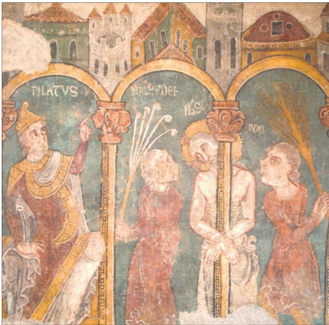
La 'Flagel·lació de Jesucrist' és un dels murals de Sant Esteve que podrien tornar a Andorra.