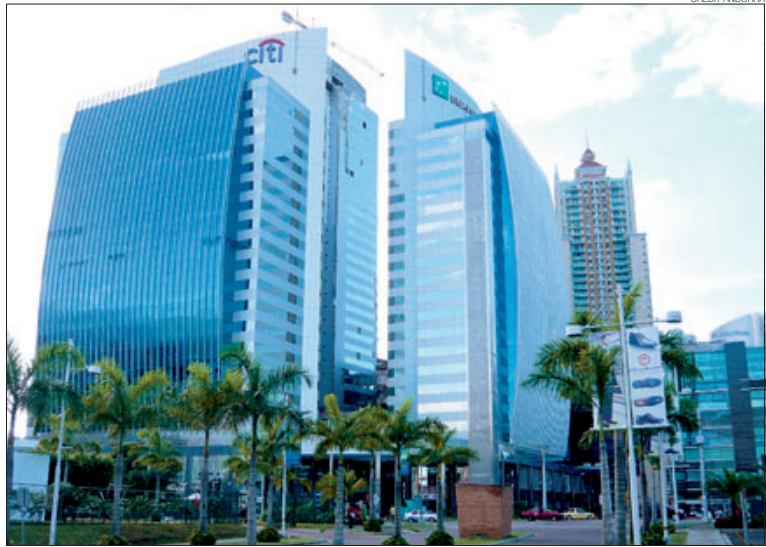
► La Torre de las Américas, on hi ha la nova oficina de Crèdit Andorrà.

El naixement del Banco Crèdit Andorrà (Panamà) queda emmarcat dins de l'estratègia d'internacionalització del Grup Crèdit Andorrà, concretament, en el pla d'expansió per l'Amèrica Llatina. Aquest procés d'internacionalització «respon a la voluntat de continuar creixent i consolidar el negoci dintre i fora de les nostres fronteres», hi afegeixen en el comunicat. De fet, tal com va avançar aquest rotatiu, la Superintendència de Bancs del Panamà va autoritzar el mes de setembre passat una llicència Internacional bancària a Crèdit Andorrà per obrir el nou banc. Crèdit aposta pel Panamà perquè és un país que «gaudeix d'una situació privilegiada dintre de Cen-