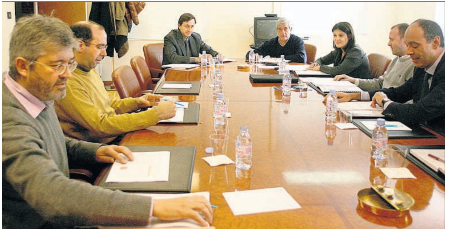
Els membres de la comissió de Finances van tancar ahir el darrer pressupost de la legislatura.

L'única infraestructura que es finançarà amb les noves fórmules serà el vial de Sant Julià, tot i que amb un cost de finançament més reduït per adaptar-se a la davallada dels tipus d'interès, i amb un cost de manteniment igualment més baix, per afrontar el descens de la inflació. Això farà que el total que es pagarà per l'obra (ini-